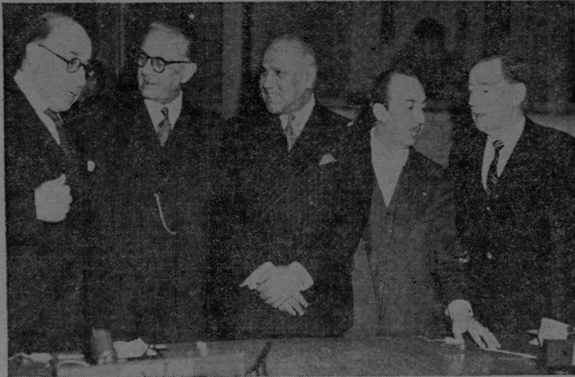
El Comité Especial de las Naciones Unidas, para investigar lo sucedido en Hungría y que dió a la publicidad un informe de ciento cincuenta mil palabras con pruebas sobre la intervención del Ejército Rojo en el aplastamiento de la rebelión nacional de Hungría, informe que causó sensación en el mundo por su objetividad y porque pone de relieve la brutalidad soviética, estuvo integrado por representantes de cinco naciones que aparecen en el grabado. De izquierda a derecha: doctor Enrique Rodríguez Fabregat, de Uruguay; Alsing Andersen, de Dinamarca; R. S. S. Gundewardene, de Ceilán; Mongi Slim de Túnez y Sir Percy Spender, de Australia.