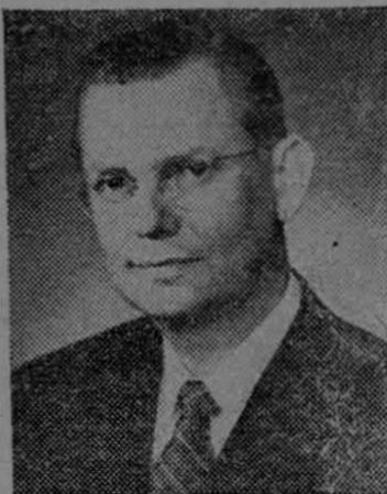
Robert B. Anderson, nuevo secretario del Tesoro, de los Estados Unidos de Norteamérica.