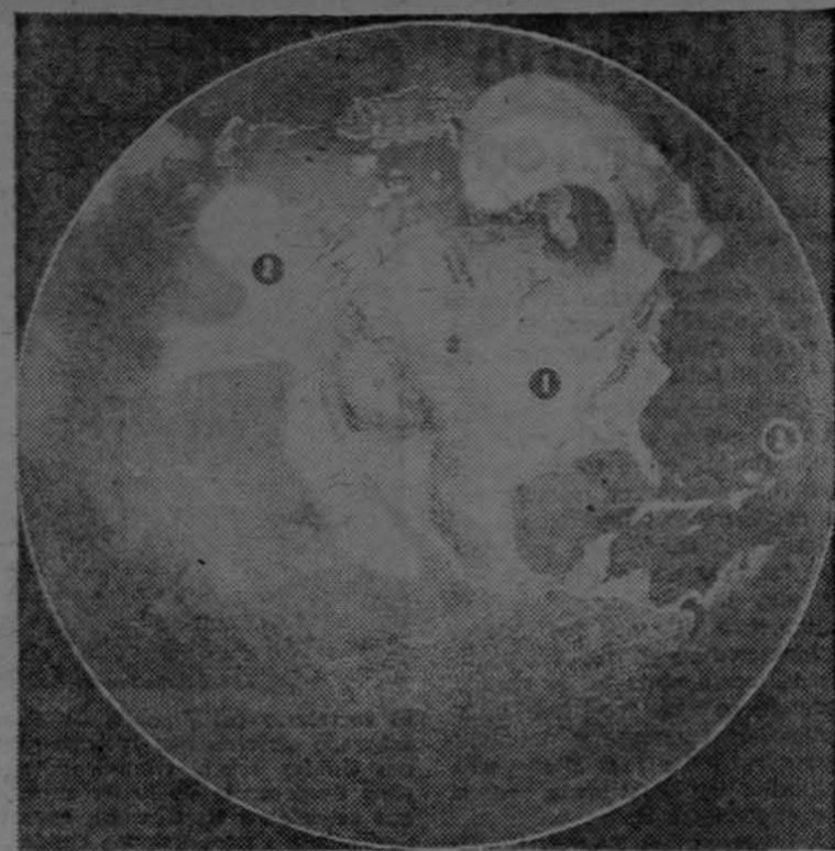
Así se imaginó el ambiente las condiciones climatológicas terrestres desde una altura de 6,400 kilómetros. Los meteorólogos esperan que los satélites que lanzarán los Estados Unidos al espacio durante el Año Geofísico Internacional en vigor, aportarán importantes datos sobre el conocimiento del clima terrestre. El grabado muestra lo que captaría una cámara de televisión al pasar, en un satélite, sobre la parte sudoccidental de los Estados Unidos y México. A la derecha (1), se ve una vasta mesa de nubes que revela la existencia de tres tormentas que se extienden desde la bahía de Hudson, en Canadá, hasta la frontera de México. A la izquierda (2), otra serie de tormentas atraviesa hacia el suroeste, desde el Golfo de Alaska. Abajo, a la derecha (3), aparece un huracán en el Caribe. La línea de puntos, a través de los océanos, son masas de nubes arrastradas por los vientos.

La insuperable resistencia del nuevo cordón de rayón a la tensión provee mayor protección contra el rompimiento y reventones del neumático, haciéndolo, por lo tanto, más durable.